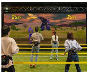
ヨケキル WITH G