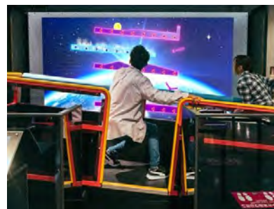
ドロップシーソー WITH G