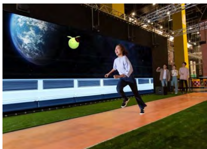
ニゲキル WITH G

ほかにも「チャレンジピッチング WITH G」、「ガンダム VR ダイバ強襲 TM」、「ぼかぼかスタジアム WITH G」、「パニックピンポン WITH G」、「カートコーナー WITH G」を含む「VS PARK」の人気アクティビティ8種類が「ガンダムパーク福岡」でしか体験できないガンダム仕様で登場します。