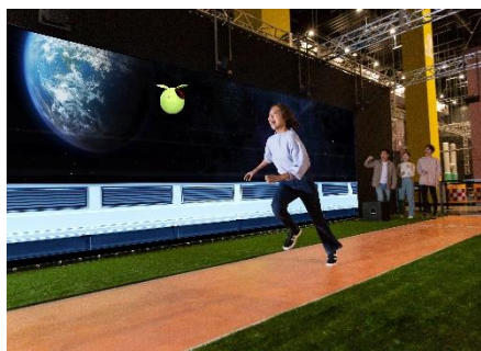
ニゲキル WITH G

ほかにも、「チャレンジピッチング WITH G」、「ガンダム VR ダイバ強襲™」、「ぽかぽかスタジアム WITH G」、「パニックピンポン WITH G」、「カートコーナー WITH G」を含む「VS PARK」の人気アクティビティ 8 種類が、「ガンダムパーク福岡」でしか体験できないガンダム仕様で登場します。