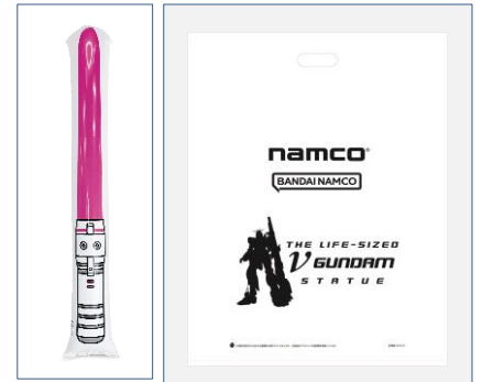
「ガンダムパーク福岡」専用 ビームサーベルバルーン イベント専用景品袋