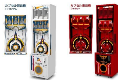
カプセル景品機「ららぽーと福岡専用スプーン」