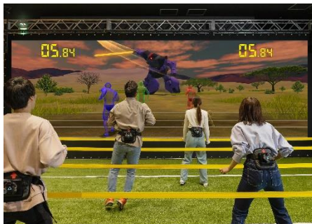
ヨケキル WITH G