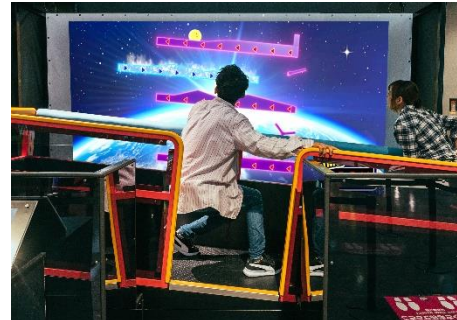
ドロップシーソー WITH G