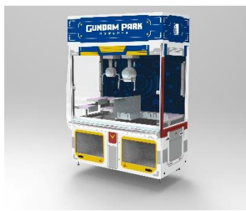
クレーンゲーム機「ららぽーと福岡専用クレナハイブリット」

©創通・サンライズ 太鼓の達人™ & ©Bandai Namco Entertainment Inc.