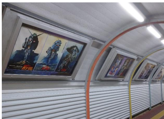
さながら宇宙コロニーの通路のような趣き

◇荻窪地下道は今後、ギャラリーとして“アニメのまち杉並”らしい企画なども楽しめる予定です。