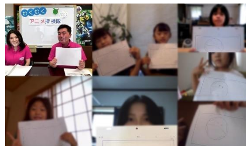
企業訪問オンラインのプログラムを活用し アニメの制作道具に触れながら学ぶ「アニメ探検隊」