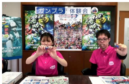
初心者でも楽しめる「ガンダム体験」