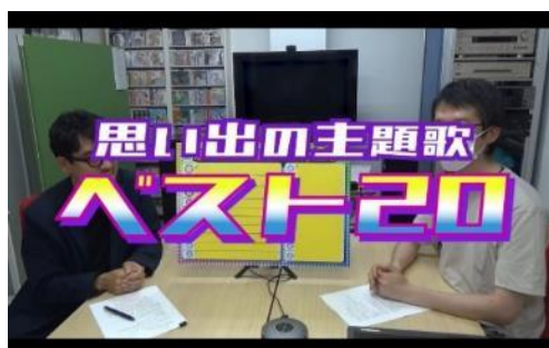
七夕☆配信チャンネルより 社員投票による「思い出の主題歌ベスト20」